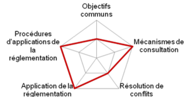
Graphique 3. Radar plot de la gouvernance du Parc national du Banc d'Arguin